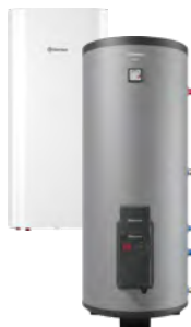
Комбинированные (косвенные) водонагреватели