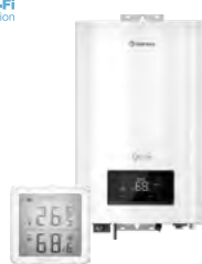
Электрические котлы и комнатные термостаты